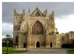
Ci-contre la cathédrale d'Exeter.

Le mardi nous sommes allés à Newton Abbot où nous avons fait un rallye dans la ville puis nous sommes allés visiter la cathédrale d'Exeter.