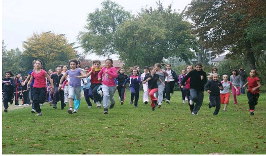
Photographie du départ des 6 e filles

Le Cross s'est déroulé le vendredi 26 octobre 2012 selon l'ordre suivant : les 5 e ont pris le départ, les 6 e ensuite, puis les 4 e et pour finir les 3 e .