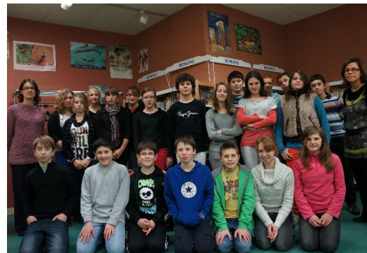
L'équipe de rédaction de L'Encre du Marin

A chaque année, des projets, et donc des nouveautés à vous présenter. Une nouvelle équipe aussi, plus nombreuse, pour vous offrir encore plus d'informations sur le collège et sur l'actualité culturelle. Bonne navigation dans ce nouveau numéro !